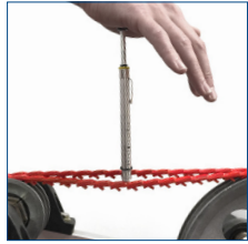
Tekrar Gerdirme Gerektirmez