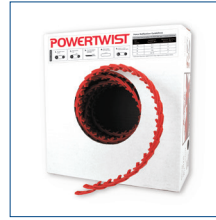
Basit Stok Yönetimi